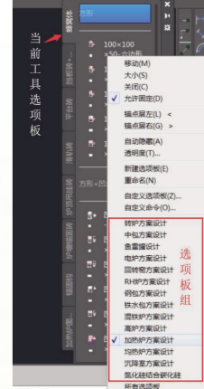
图2. 当前“蜂窝体选项板”

使用图库中图块工具, 操作简单、高效。根据需要选择合适的工具选项板, 并置于当前, 从当前选项板显示的块工具图标中, 选择需要的块, 采用拖放的方法, 即在绘图区域指定位置轻松地创建该块的图形。当标准件图块插入到绘图区域后, 可以根据需要在位调整块或者炸开块。